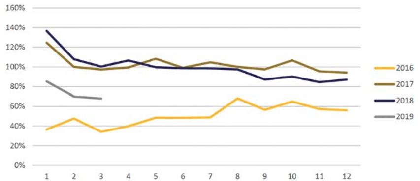
Grafiek: Meerkosten niet-gecontracteerde zorg per maand

Uit de rapportage van Vektis blijkt dat aanbieders die volledig niet-gecontracteerd zijn in aantal groeien van 1.389 in 2016 naar 2.214 in 2018. Daar staat tegenover dat in 2018 er 492 aanbieders zijn die met alle zorgverzekeraars een contract hebben. De niet-gecontracteerde aanbieders zijn veel kleiner dan de aanbieders die volledig gecontracteerd zijn. Het grote aantal aanbieders wijkverpleging leidt tot fragmentatie van het zorgaanbod en bemoeilijkt de samenhang van de zorg.