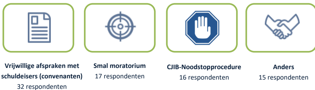
Figuur 4.2 Overzicht gebruik alternatieve instrumenten (N=48)

Binnen de ‘Anders’ optie geven 7 van de 15 respondenten aan dat er geen convenanten zijn gesloten, maar wel onofficiële vrijwillige afspraken met de schuldeisers zijn gemaakt (op basis van goede relaties).