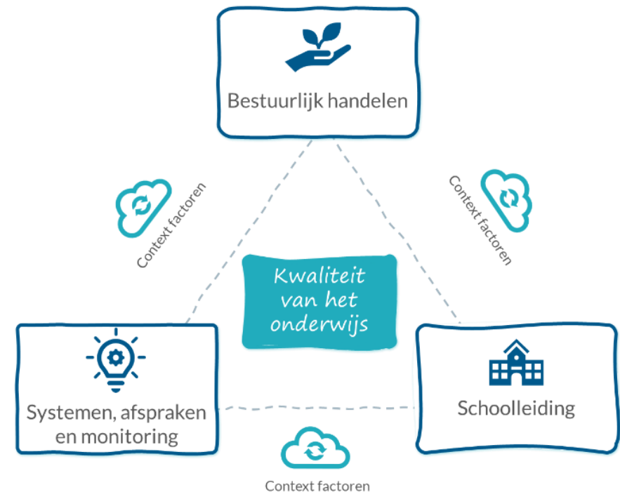
Figuur 1 | Speelveld besturen van kwaliteit